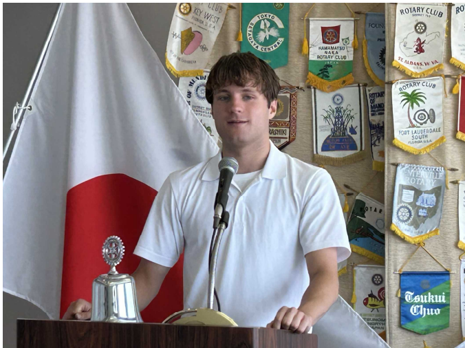
近況報告がありました。