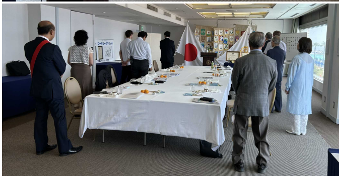
君が代・奉仕の理想 四つのテスト