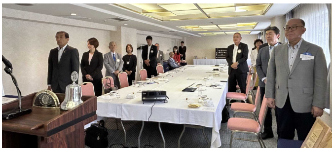
君が代・奉仕の理想・四つのテスト