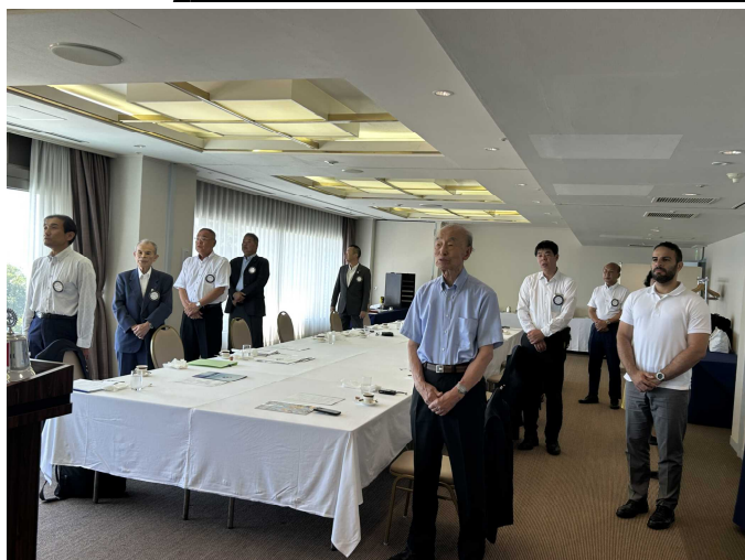
ロータリーソング・四つのテスト