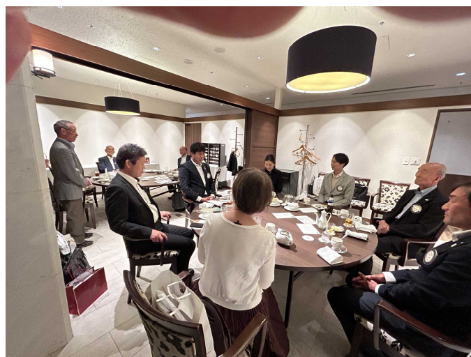
手拍子”3本締め” めでたくお開き

私の歯がガタガタで医者に通っている最中で、私の言ってる事が伝わっていないんじゃないか？＝大丈夫！伝わってます…(^0^)= 新潟県にある姥捨山から来たような調子ですが、皆さんのご厚情で宜しくお願いします。(笑と拍手)