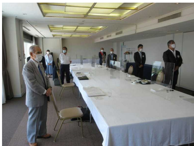
君が代・奉仕の理想