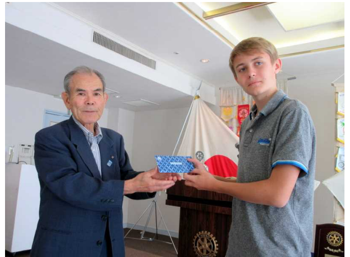
ティトウス君へプレゼント：図書券