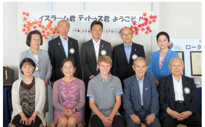
集合写真：出席者全員